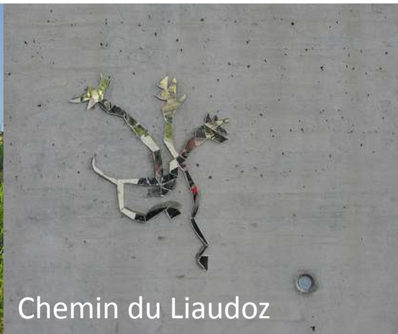
Chemin du Liaudoz