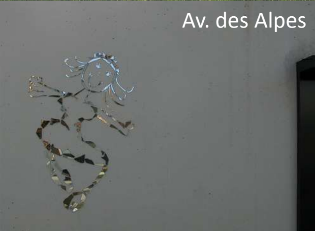
Av. des Alpes

http://www.flickr.com/photos/maxbucher/3682382142/sizes/o/in/photolist-6BpaVh-5NhpZ6-hvG36A/ http://www.flickr.com/photos/maxbucher/3149267707/sizes/o/in/photolist-5NhpZ6-hvG36A/