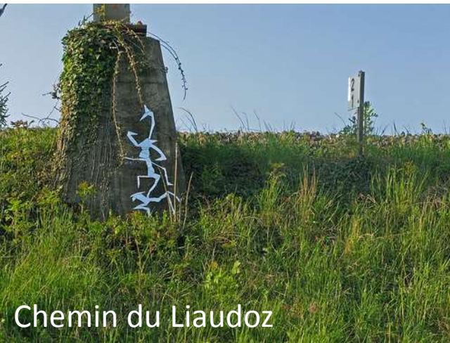
Chemin du Liaudoz