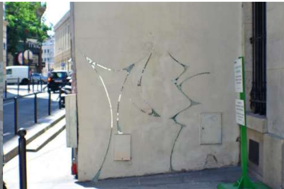
38b – St André des Arts