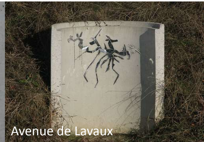
Avenue de Lavaux