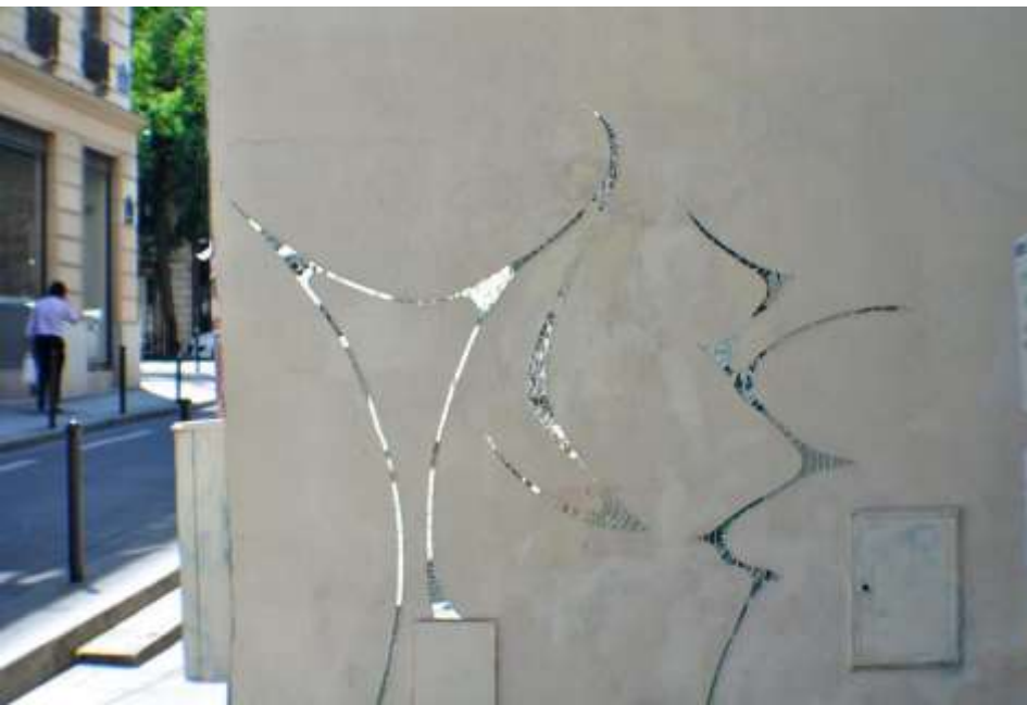
38a - 75006 paris